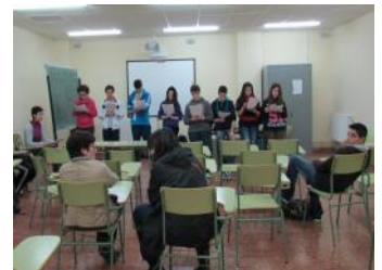
Acto multilingüe: Lectura en lengua portuguesa del cuento El canto de boda de Dulce Chacón .