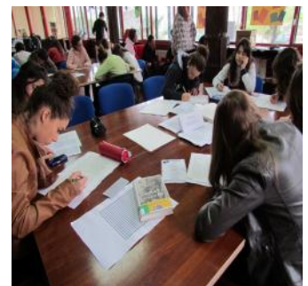
Escritura del libro Cielos de barro por parte de alumnos en la Semana de la Literatura.

marco de la celebración de la denominación de nuestra biblioteca como Dulce Chacón , una de las actividades que se han realizado ha sido la escritura a mano, por parte de nuestro alumnado del libro de la citada autora Cielos de Barro , cuya acción está ambientada en nuestra comarca.